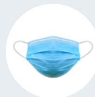
Masque médical (de procédure)

Le couvre-visage n'est PAS un équipement de protection approprié au travail. Il peut être porté par les travailleurs en supplément des mesures décrites ci-dessus.